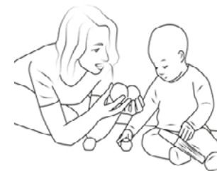
Рис. 4. Находим знакомые игрушки

игрушку среди двух знакомых. Как только малыш научится выбирать из двух игрушек, поставьте третью и начните всё сначала (см. рис. 4).