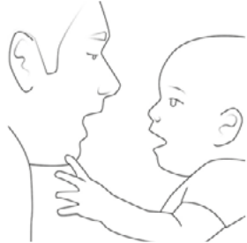
Рис. 1. Подражание звукам взрослого

Высуньте язык, сделайте им «болтушку», привлекая внимание малыша. Открывайте рот, пропевая звуки «а-а-а-а-о-о-о»; вытягивая губы «трубочкой», пропевайте «у-у-у-у-у-у-у». Надуйте щёки и фыркайте. Малыш, видя ваши забавные действия, обязательно через некоторое время начнёт вам подражать (см. рис. 1).