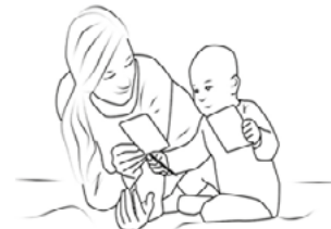
Рис. 6. Рассматриваем картинки

Покажите две разные картинки и попросите: «Найди мне печенье». Когда рука ребёнка дотронется до правильной картинки, похвалите ребёнка и скажите: «Да, это печенье, его можно есть». Повторите процедуру с каждым предметом. Заведите альбомы с вырезанными из журналов картинками, которые вы сможете использовать снова и снова. Выберите изображения тех предметов, которые ваш ребёнок любит больше всего. Но включите туда также изображения других, менее знакомых вашему ребёнку.