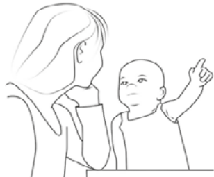
Рис. 3. Ответ на вопрос взрослого «Где?»

3. Продолжать развивать речевой аппарат, побуждая малыша к ярким вокализациям – произнесению чётких гласных, протяжных звуков (гуление) и лепету (простейшие слоги типа «Ва-ва-ва» или «Бу-у-у» и т.д.).