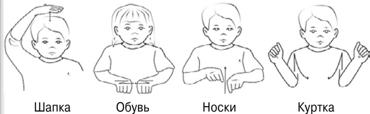
Рис. 7. Жестовый язык

языка, их легче использовать вместе с речью. Это важно, потому что в работе с альтернативной коммуникацией речь и жесты обычно используются одновременно (см. рис. 7).