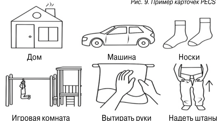
Рис. 9. Пример карточек PECS

Изображениями, которые используются в программе, могут быть фотографии, цветные или чёрно-белые рисунки или даже небольшие предметы (см. рис. 9).